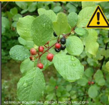
NERPRUN BOURDAÏNE

Le nerprun bourdaïne est un arbuste pouvant atteindre 8 mètres de haut, ses graines ont un taux de germination très élevé, il possède une forte croissance lui donnant un avantage face aux espèces indigènes et peut pousser dans des conditions très variées. Une fois implanté, il peut être TRÈS ENVAHISSANT et il est TRÈS DIFFICILE de s'en débarrasser. Il est un réel danger pour la biodiversité des milieux humides qu'il affectionne et pourrait mettre en péril l' acériculture , la foresterie et les nombreux usages récréatifs de la forêt publique de la Seigneurie de Lotbinière.